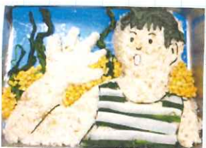
くりごぐみのかいりく

さくらぐみさんの大好きな絵本「電車」をイメージしてまぼろしで作りました。土台のごはんはにんじんごぼうです!