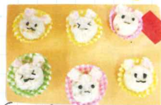
つくしぐみ、れんげぐみは子どもたちの大好きな動物「うさぎ」とペンギンをおいずりにしました。

昼夜の寒暖差もだんだんと大きくなり、少しずつ冬の訪れを感じるようになってきましたね。風邪をひきやすくなるこの季節のかわり目、しっかりご飯を食べて元気にのりましょー!!