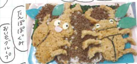
たんぽぽぐみ おしどりぐみ

V-ラン節のにしん漁をイメージして、にしんと船にしました。玉わさじごぼうとまぼろし味付けごぼうで作りました。